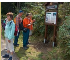
Köglerova naučná stezka