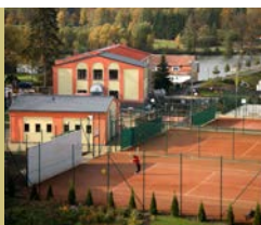
Sportovní areál v Krásné Lípě