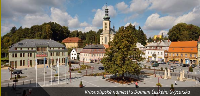
Krásnolipské náměstí s Domem Českého Švýcarska