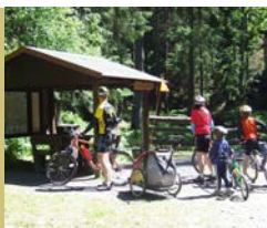
Cyklisté v Kyjovském údolí