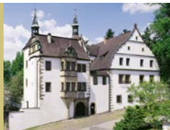
Zámek Benešov nad Ploučnicí