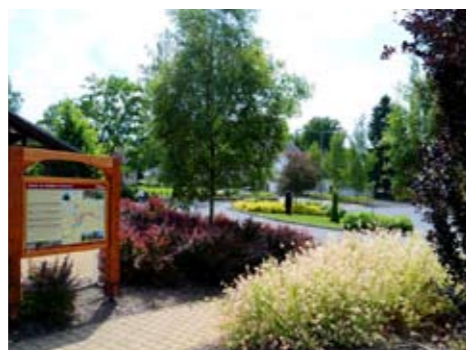
Krásná Lípa vyniká úžasně obnovenou či nově založenou zelení a parkovou úpravou a kultivací veřejných prostranství.

nového typu rozšiřuje sousední penzion, vybudovaný s velkou řemeslnou pečlivostí z někdejšího faktorského domu, a hostel, který pro změnu vznikl v horních patrech bývalé továrny. V ní našly místo i doplňující služby jako solárium, masérna, sauna a fitness, nejnověji i dvojice špičkových bowlingových drah.