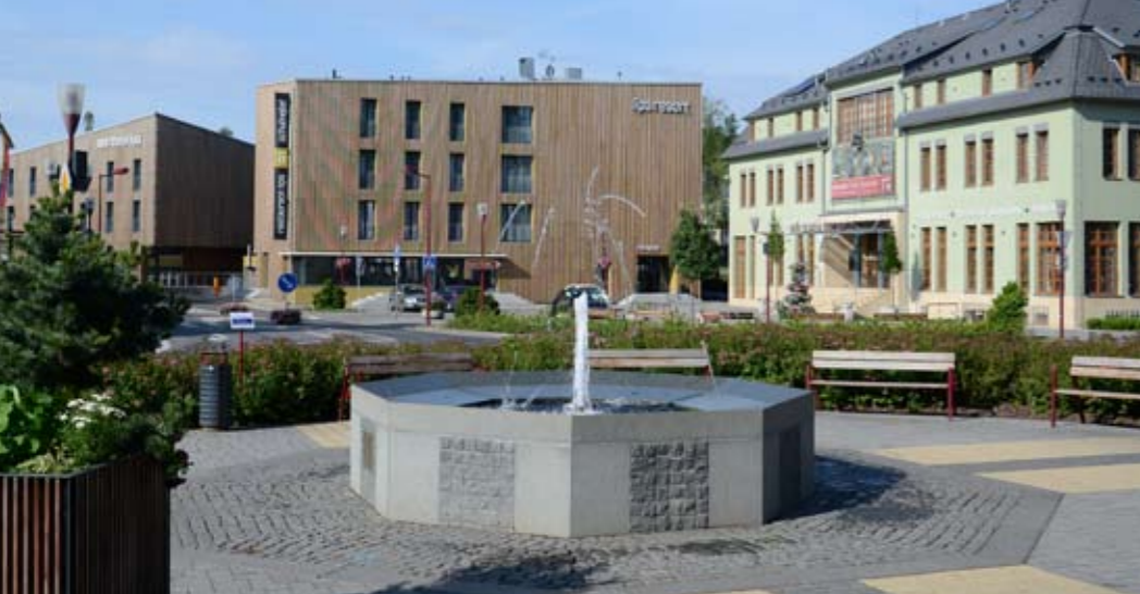
Na náměstí vyrostl Dům Českého Švýcarska a Aparthotel s mnohými službami.