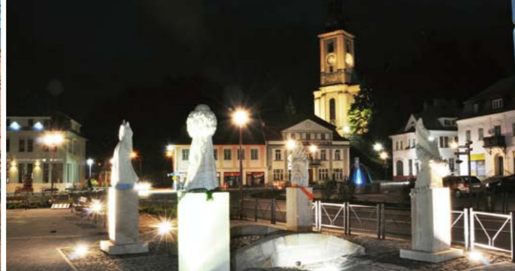
Křinické náměstí je příjemné ve dne, magické večer.