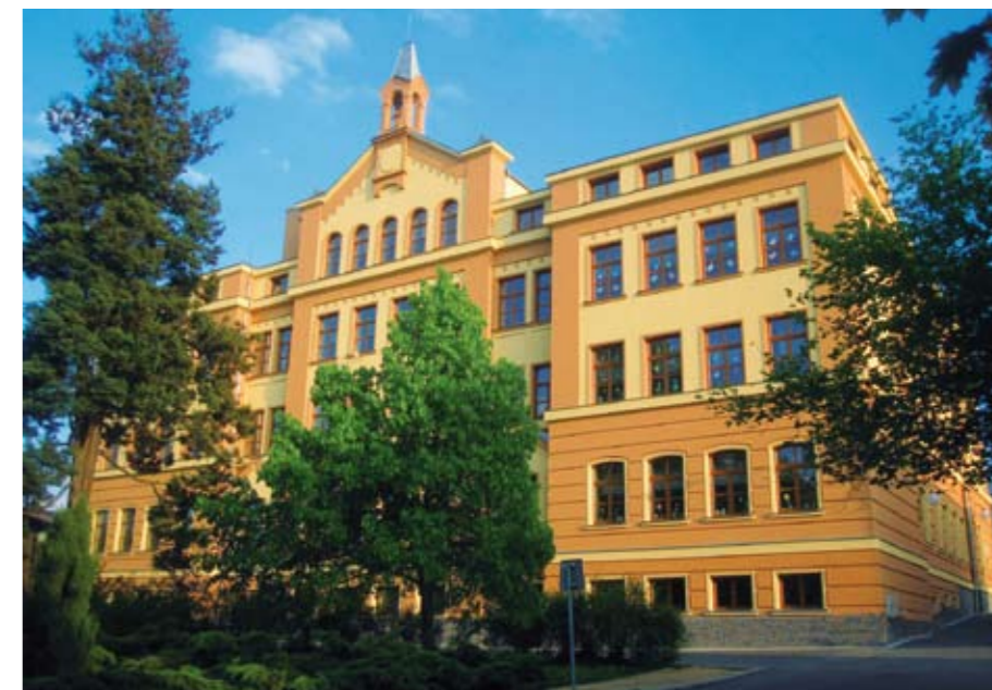
Máme nově zrekonstruovanou základní školu a celý její areál vč. budov školní jídelny a školní družiny.

základní školu ve modernizované historické budově, dobré silniční i železniční spojení a samozřejmě dostatečně kapacitní inženýrské sítě. Je tu klidné bydlení obklopené fantastickou přírodou. Postavili jsme přes 120 nových bytů, z toho více než polovinu tvoří moderní byty s pečovatelskou službou. Zrekonstruovaný objekt kina slouží i jako multifunkční kulturní dům.