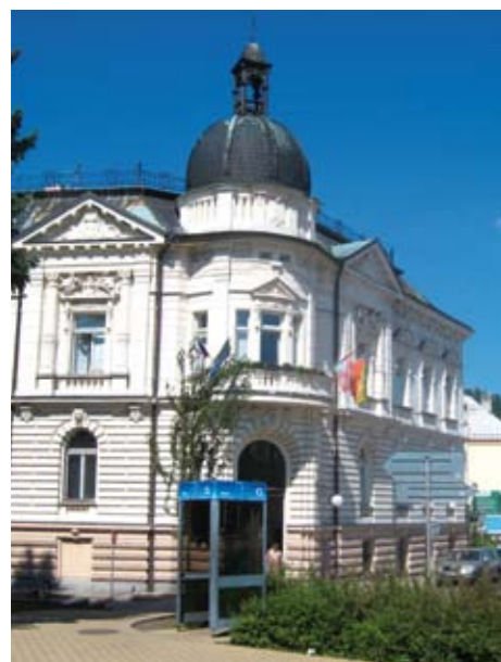
Budova radnice je opět nádherným objektem v centru města.

Centrum a srdce města, Křinické náměstí, se po rekonstrukci proměnilo v příjemné a útulné místo. Mimochodem, v r. 2010 se stalo Dopravní stavbou roku ČR.