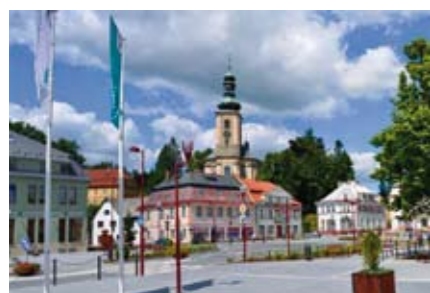
Po šedesátileté odmlce se v Krásné Lípě opět vaří pivo, a to pivo Fajkeštejn v novém minipivovaru hned pod kostelem na náměstí.

Na tradici zdejší hodnotné architektury navázal v poslední době v centru města Lípa resort, soubor několika staveb, z části historických a památkově chráněných a z části úplně nových. Jeho část, novostavba tří budov s velkými podzemními parkovišti pod názvem Aparthotel Lípa, se stala Stavbou roku ČR 2013. Nabídku prvotřídního ubytování apartmá-