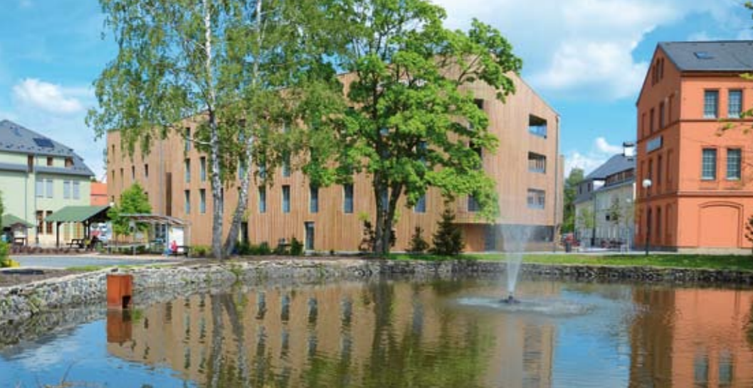
Upravená veřejná prostranství jsou vizitkou města.