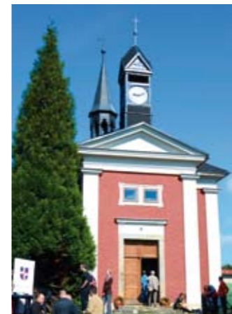
Podstávkové roubené domy jsou fenoménem lidové architektury Českého Švýcarska. Kulturní krajinu zdobí i drobné sakrální památky a kaple ve Vlčí Hoře.