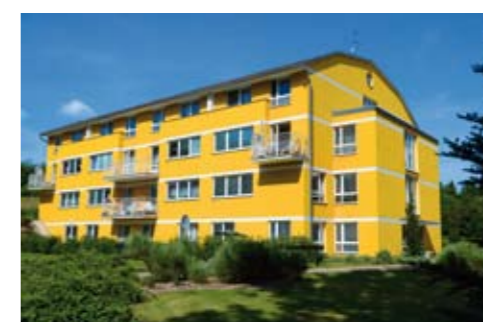
Dva moderní domy s pečovatelskou službou jsou bezpečným zázemím pro seniory.

Nový územní plán rozšířil možnosti výstavby rodinných domů. Pozemky v klidných lokalitách jsou prodávány za dostupnou cenu a Krásná Lípa nabízí vysoký standard občanské vybavenosti, zahrnující síť obchodů a služeb, lékařskou péči, dostatečnou kapacitu předškolních zařízení, dobře vybavenou