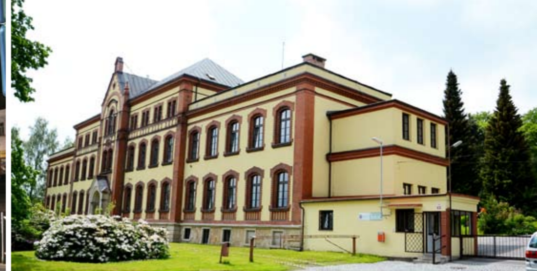
V sousedství sídliště je v několika zrekonstruovaných objektech areál domova seniorů s parkem.