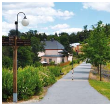
Parkové úpravy u kina a kulturního domu.

Přímo na náměstí najdete například chodskou pekárnu s velice dobrým pečivem i malou čokoládovnu. A nově můžete posedět i v Křinickém pivovaru u sklenice pěnivého Falkenštejna.