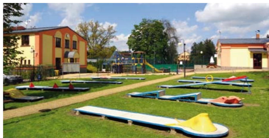
Velký sportovní areál má mnoho sportovišť, a to i na zimní období, kdy slouží velká nafukovací hala a zmodernizovaná tělocvična. Jsou zde i další zajímavosti jako velké lezecké stěny (až 10 m výšky), minigolf a mnohé aktivity pro děti.