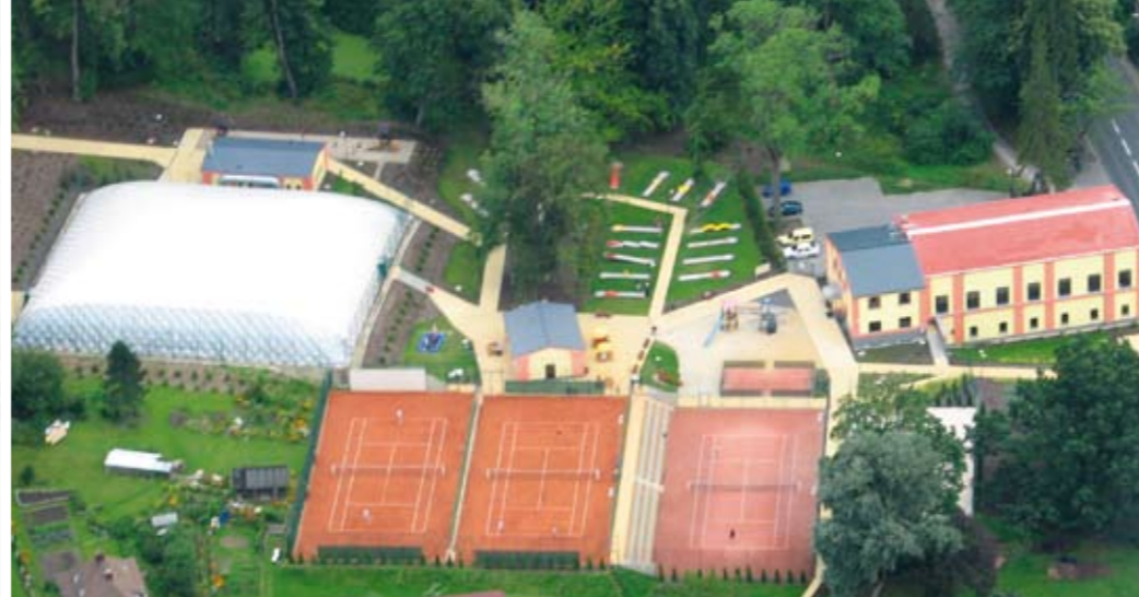
Sportovní areál Českého Švýcarska – místo pro sport, zábavu i odpočinek.